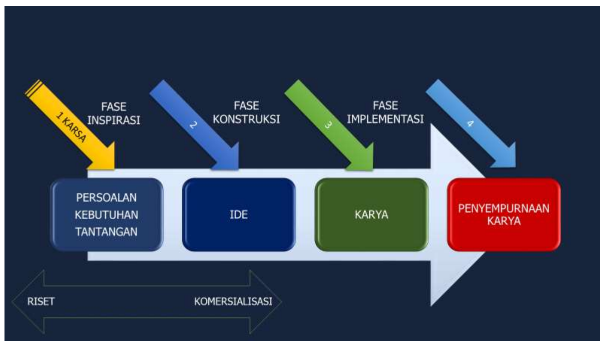
Gambar 1. Bagan alir proses konstruksi ide dalam PKM-KC

Tahap akhir PKM-KC adalah Fase Implementasi di mana produk dapat difungsikan dan dinilai level kemanfaatannya. Dalam kasus tertentu, jika produk PKM-KC belum fungsional, paling tidak fase Konstruksi sudah tercapai dan dilakukan uji coba (lihat Gambar 2.).